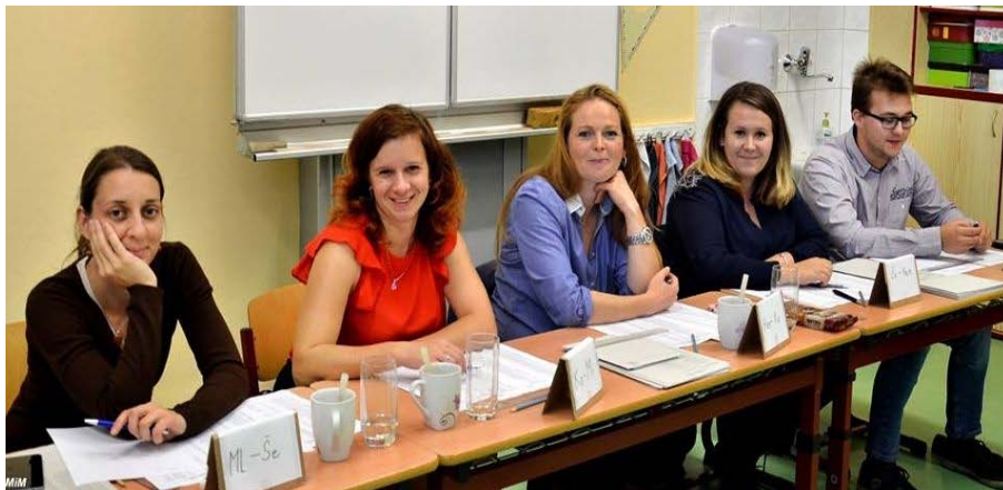
Volební komise okrsku č. 1 v Jincích.