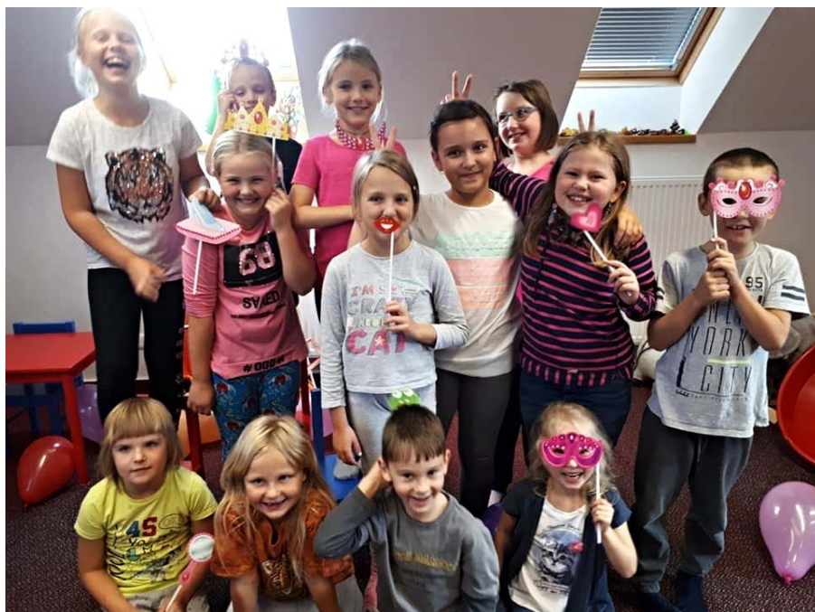
Děti z oddílu Trilobit

S ohledem na omezený počet dětí prosím o přihlášení na tel. 777 793 701 nebo e-mail: marketa@pionyr.cz