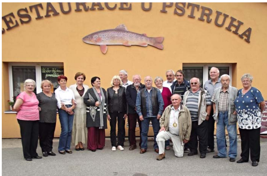
Společná fotografie bývalých spolužáků – foto autor.