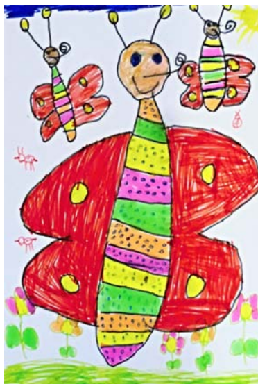
Jedna z vyhodnocených prací

Více foto: https://knihovna-jince.rajce.idnes.cz/Vyhodnoceni_vytvarne_souteze_na_tema_Hmyz/