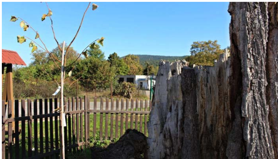
Druhá památná lípa byla vysazena 22. 9. 2018 u torza té původní, která padla při vichřici v r. 2016

Souhrnné fotoalbum: https://kultura-jince.rajce.idnes.cz/Sazeni_pamatneho_stromu_u_huti_Barbora/