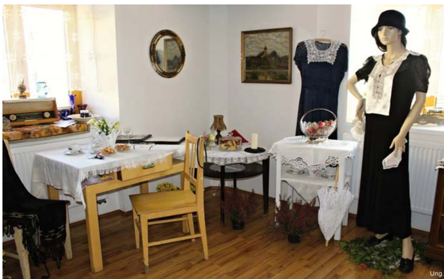
Jedna z expozič výstavy