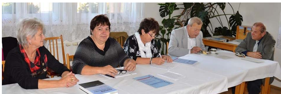
Volební komise v Čenkově.